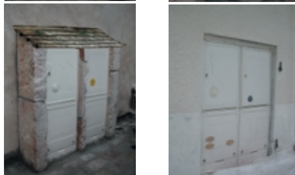
Poses en retrait de 5 cm en l'attente d'une porte.